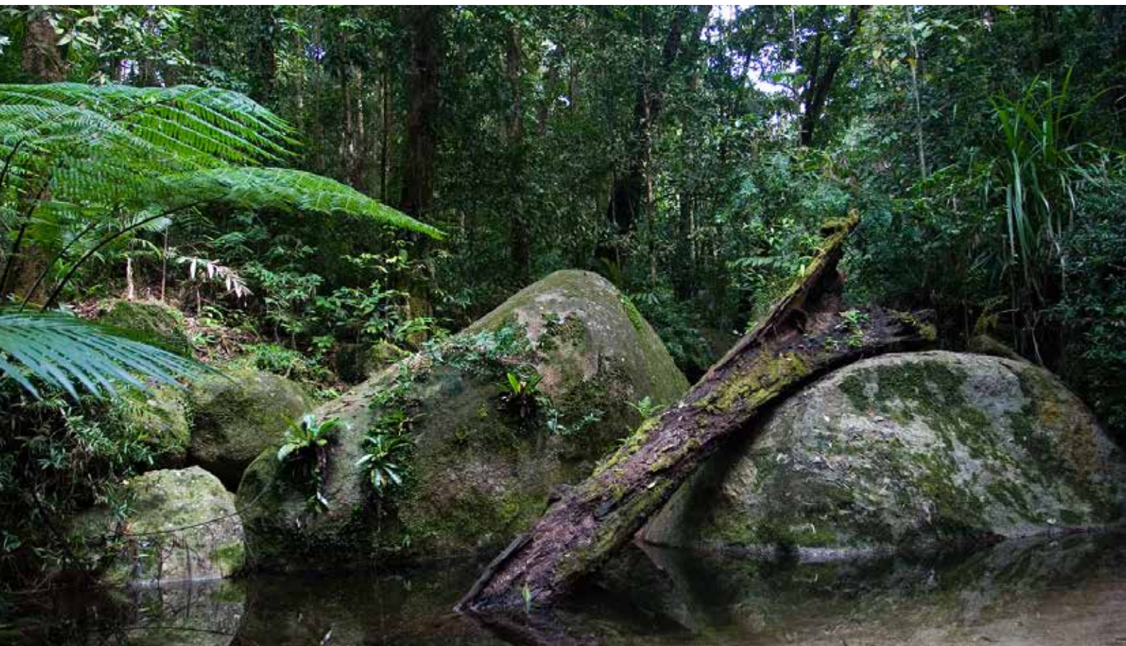
Daintree – der älteste Urwald der Erde

135 Millionen Jahre – so alt ist Australiens Daintree-Dschungel, in dem Bennett-Baumkängurus und Riesenbeutelmarde leben und flugunfähige Helmkasuar einen Rückzugsort finden. Kein Wunder, dass die Regenwälder im Bundesstaat Queensland vor 30 Jahren als Welterbe unter Schutz gestellt wurden – allerdings nur lückenhaft.