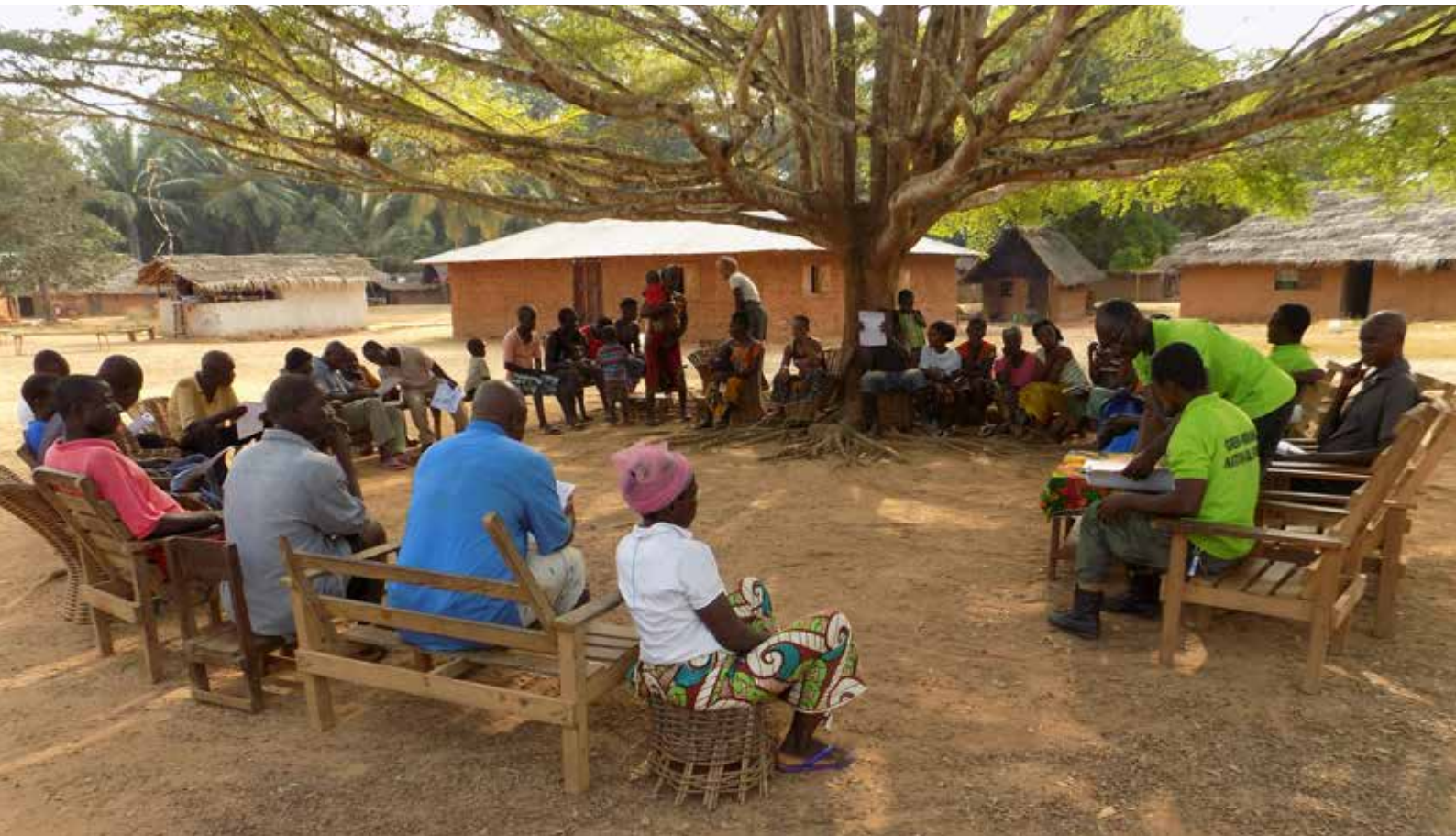
Eco-Guards klären die Bevölkerung über die Regeln im Nationalpark und ihre Rechte auf

Für Freunde der Schimpansen gab es gleich zweimal etwas zu feiern: In Liberia und Guinea wurden zwei neue Nationalparks für die Menschenaffen eingerichtet. Eine treibende Kraft dahinter ist die Wild Chimpanzee Foundation (WCF). Wir haben die Organisation mit Spenden unterstützt - und freuen uns riesig!