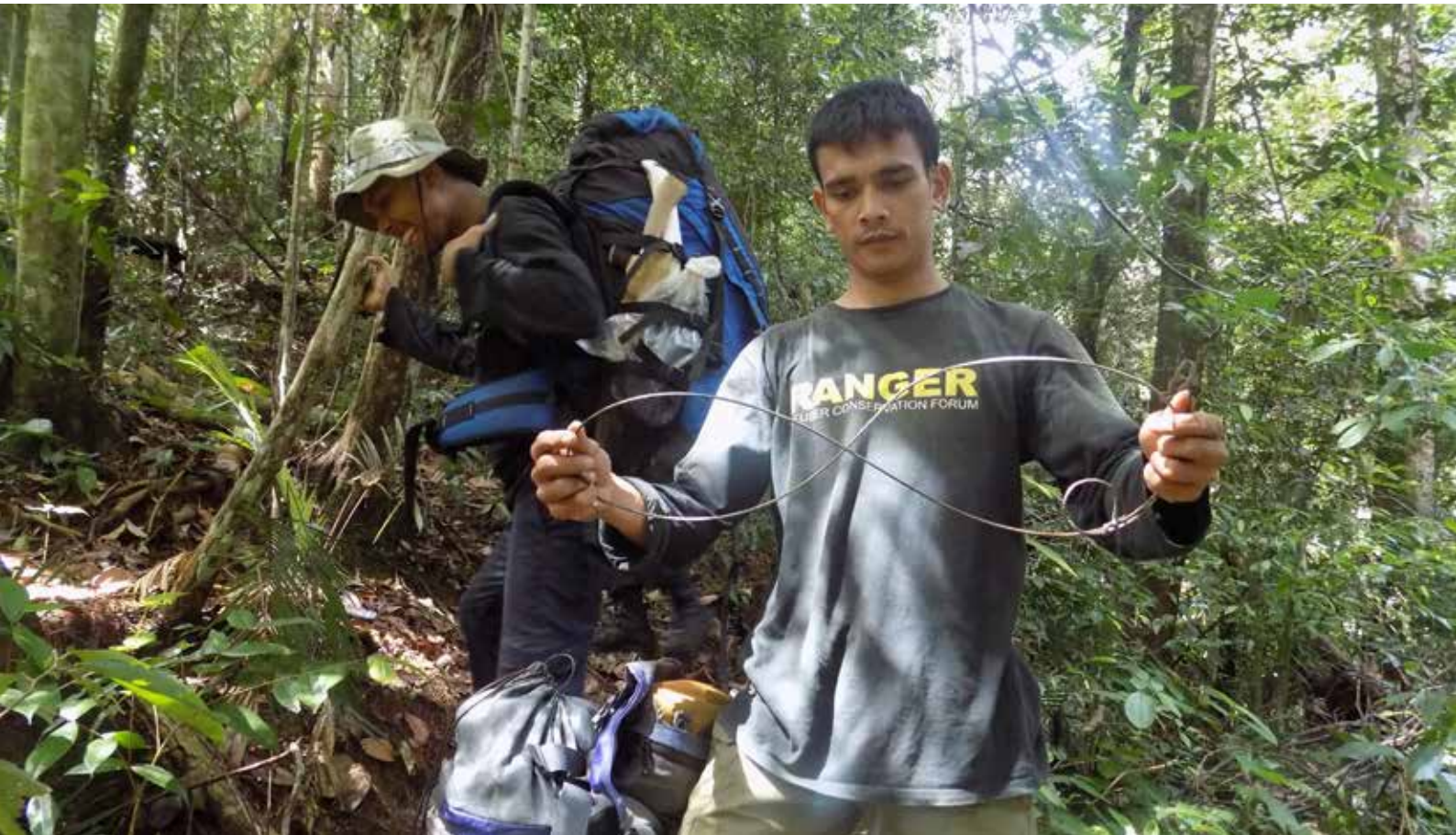
Im Leuser-Ökosystem stellen Ranger Fallen der Wilderer sicher

Das Leuser Ökosystem in Sumatras Provinz Aceh und die Urwälder von Sabah auf Borneo (Malaysia) haben eines gemeinsam: ihre zusammenhängenden, weitgehend intakten Regenwaldlandschaften, in denen die südostasiatische Großtierfauna bis heute überleben kann: Elefanten, Nashörner, Orang-Utans, Sumatra-Tiger, Malaienbären und viele andere Arten.