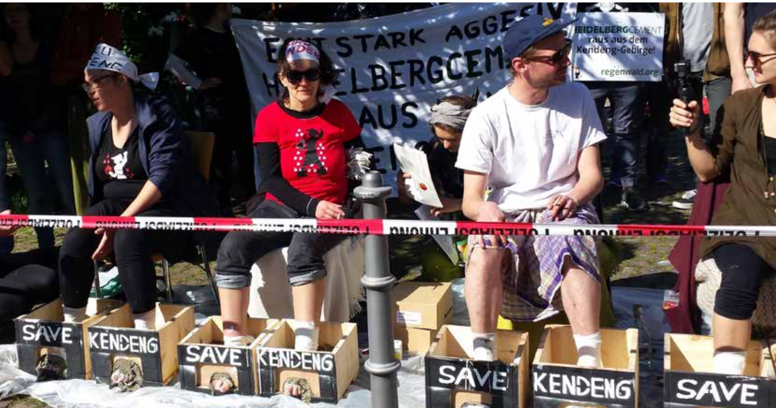
Protest bei der Jahreshauptversammlung von HeidelbergCement gegen den Karstabbau auf Java

Mit Ihrer Stimme und Ihren Spenden haben Sie auch 2017 dazu beigetragen, dass wir zusammen mit unseren Partnern in den Ländern des Südens unser Engagement für die Regenwälder fortsetzen konnten – mit Erfolgen und vielen Lichtblicken.