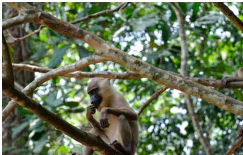
Der Drill gehört zu den bedrohten Primatenarten

In Nigerias Cross River National Park leben Waldelefanten und Schimpansen, Urwaldriesen ragen in den Himmel. Am Afi Mountain sind sogar extrem seltene Gorillas daheim. Doch den Schutzgebieten droht durch ein Straßenbauprojekt und durch Plantagen akute Gefahr. Wir arbeiten mit Umweltschützern zusammen, die gegen beides angehen. Im April haben wir die Projektpartner besucht und waren begeistert von ihrem Einsatz: