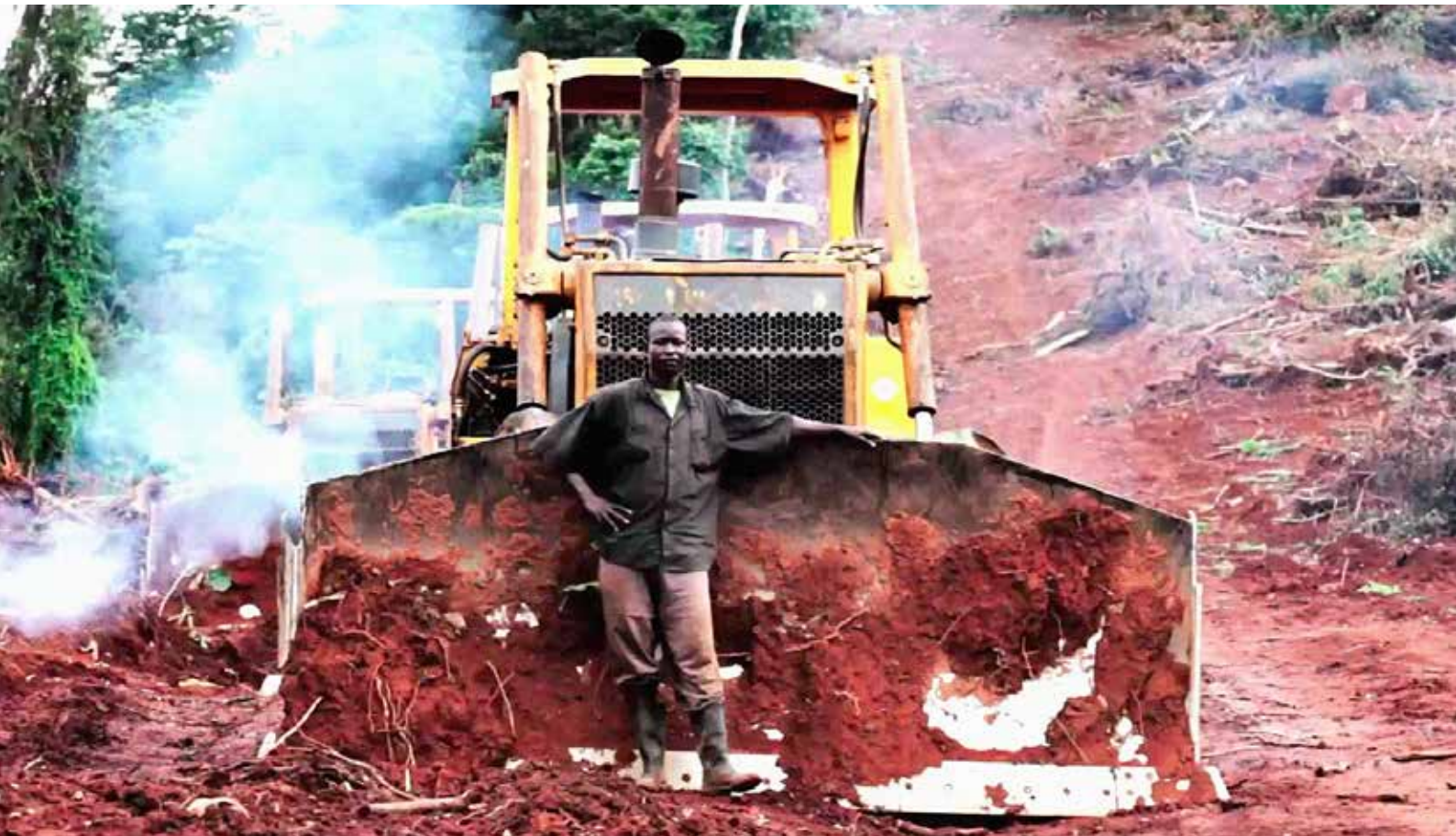
Ein Wächter will den Bulldozer einer Plantagenfirma vor protestierenden Menschen schützen

Die Bewohner der Insel Bugala im Victoriasee waren völlig unvorbereitet, als plötzlich Firmen kamen, Land in Beschlag nahmen und Wälder rodeten. Viele Familien haben dadurch ihre Lebensgrundlage verloren. Die Felder der Kleinbauern sind zerstört und die Natur ist verwüstet. Weil der Insel Buvuma das gleiche Schicksal droht, organisieren die Menschen gemeinsam den Widerstand. Die einen wollen die Erfahrungen der anderen nutzen.