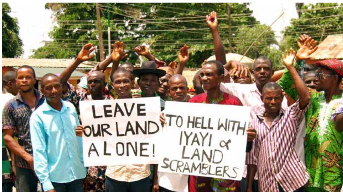
Protest gegen die Palmölfirma Okomu in Nigeria, einer Tochterfirma der Socfin-Gruppe

Ohne unser kleines Team und Ehrenamtliche wäre dies nicht möglich. Unsere Mitarbeiter halten ständigen Kontakt zu unseren Partnern im Süden, besuchen Schulen, halten Vorträge an Universitäten.