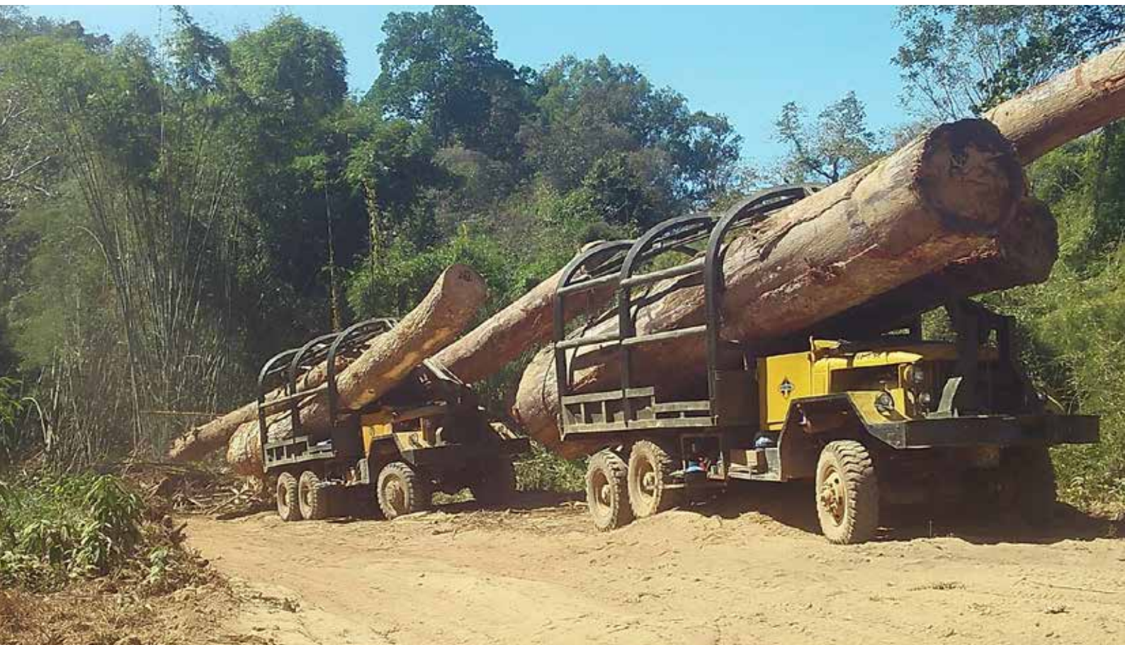
Urwaldriesen aus Kambodscha auf dem Weg nach Vietnam

Die Wälder im Osten Kambodschas werden geplündert wie nie zuvor; selbst vor Nationalparks machen die Holzfäller nicht Halt. Lastwagenweise schaffen sie das Holz aus dem Land – über die grüne Grenze nach Vietnam. Doch Regenwaldkämpfer sind den Kriminellen auf der Spur. Sie bauen ein Frühwarnsystem auf, an dem sich Aktivisten aus den Dörfern entlang der Grenze beteiligen. Mit einem „Forest Crime Monitoring“ wollen sie Beweise sammeln und eingreifen, sobald Plünderer in den Wald einfallen.