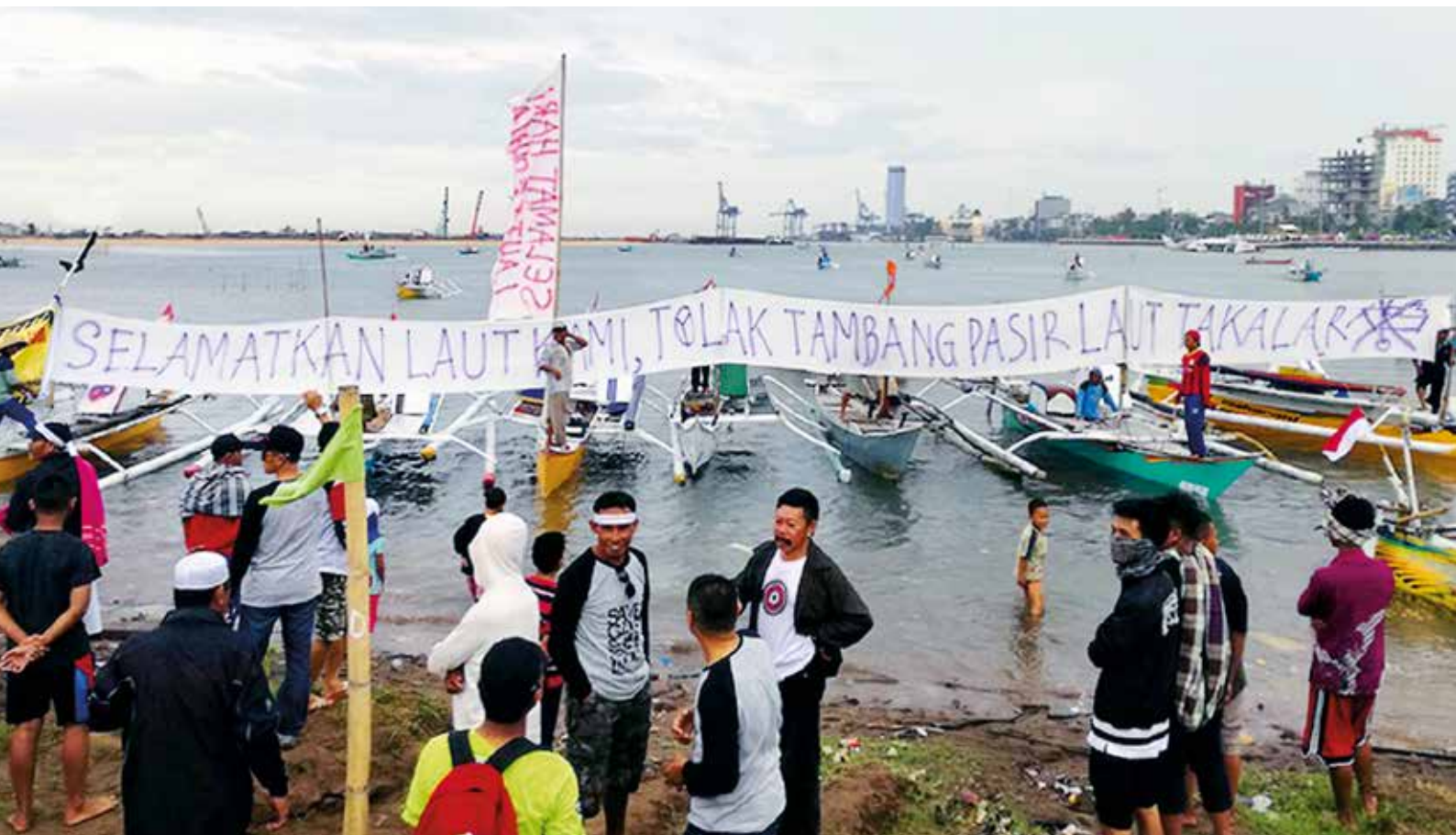
Protestaktion gegen den massiven Sandabbau

Das Anti-Bergbau-Netzwerk Jatam steht weiterhin vor großen Herausforderungen, denn nicht nur Bergbau ist ein großes Problem in Zentral-Sulawesi, sondern auch Sandraub an den Küsten und Flüssen. Mit großen Kampagnen, Demos, Medienarbeit und politischem Druck gehen die Aktivisten gegen illegal agierende Firmen vor und bringen sie vor Gericht.